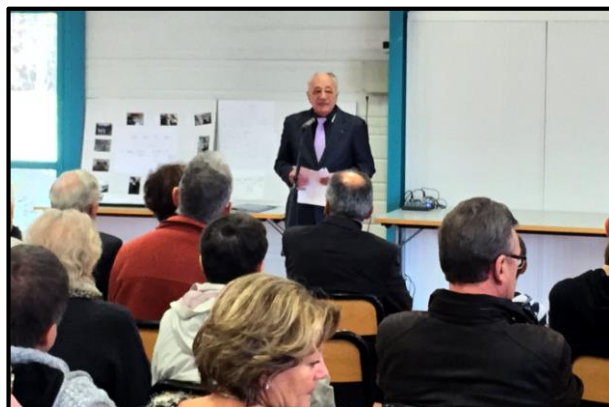
Le maire a évoqué les réalisations de 2015 et les projets, et a souhaité ses meilleurs vœux à tous.

Le discours du maire a été suivi d'une galette et d'un verre de l'amitié.