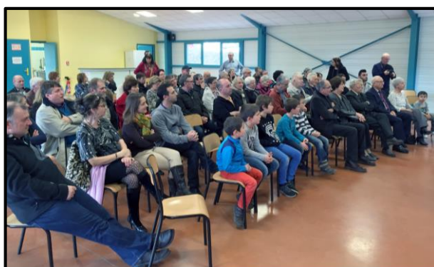
L'audience a autant goûté le discours que la galette...

Agenda : 27 novembre 2016 : bourse multicollecion 4 décembre 2016 : loto 30 avril 2017 : vide-grenier