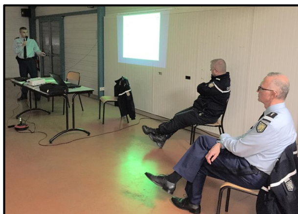
Présentation au public du dispositif de participation citoyenne par la gendarmerie de Haute-Saône, le jeudi 24 mars dernier à la salle des fêtes de Perrouse, devant environ 25 de nos concitoyens.

La commune a fait l'effort d'embaucher un employé communal pour améliorer l'entretien du village. De nouvelles décorations arbustives ont été mises en place. Ces efforts sont anéantis par certains conducteurs qui n'hésitent pas à rouler sur les trottoirs et les plantations !